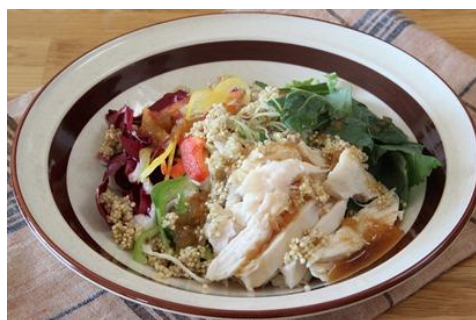
「キヌアとチキンのケールサラダ」

※サラダクラブ「野菜たっぷりレシピ」( http://c.saladclub.jp/recipe/index.html )にて3月1日(火)掲載予定