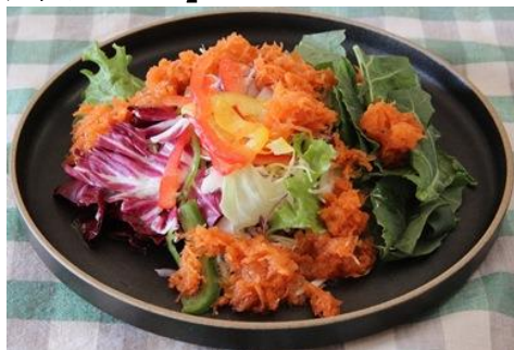
「ケールとおろし人参のサラダ」