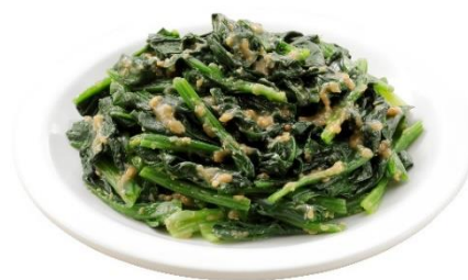
<あえるサラダ ごま和えの素>